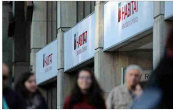
Habitat argumentó —en su análisis razonado que entregó a la SVS— que el mejor resultado obtenido a marzo se explica principalmente por el incremento en la rentabilidad del encaje.

Le sigue AFP Capital, con $22.325,7 millones, y luego Cuprum, con $22.003,9 millones.