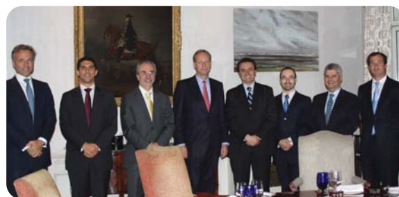
Almuerzo Lexington Partners.